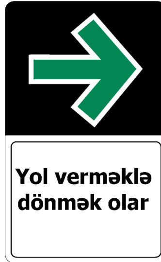
5.53 Daimi sağa dönmə

“Yol hərəkəti haqqında” Azərbaycan Respublikasının Qanununda dəyişiklik edilməsi barədə” Azərbaycan Respublikasının 2019-cu il 12 iyul tarixli 1654 nömrəli Qanununa 1 nömrəli əlavə